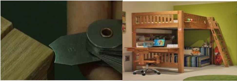
图6 儿童双层床设计制造缺陷造成碰伤夹伤风险

构件（嵌条、装填栅栏）的间隙不符合安全要求等，小孩在使用过程中容易发生碰伤、夹伤的风险，极端情况下，导致不可预见的伤害。