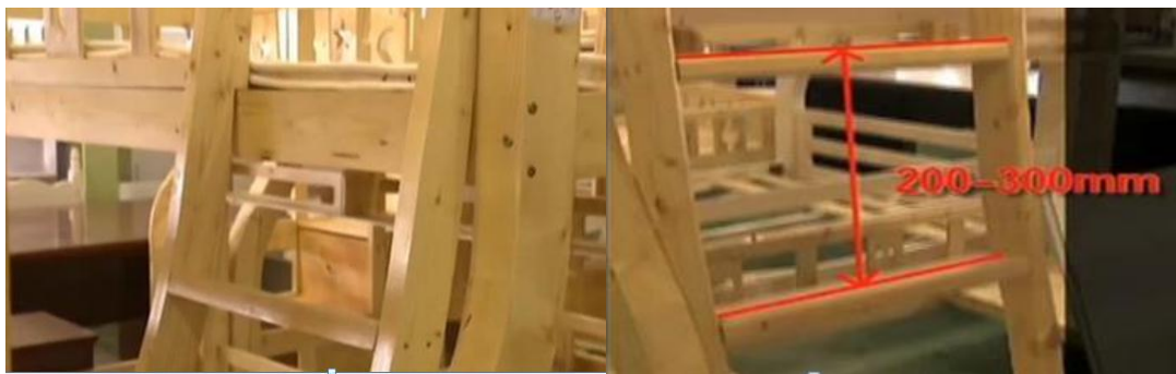
图5 双层床上下床梯子的脚踏板设计缺陷造成滑落风险

如果上下双层床梯子的脚踏板上下表面的间距过大，会增加使用者在上、下床过程中的风险，如踏脚板的宽度过小、脚踏板之间的距离不均匀等都有可能造成使用者踩空或者滑落，引发安全事故。